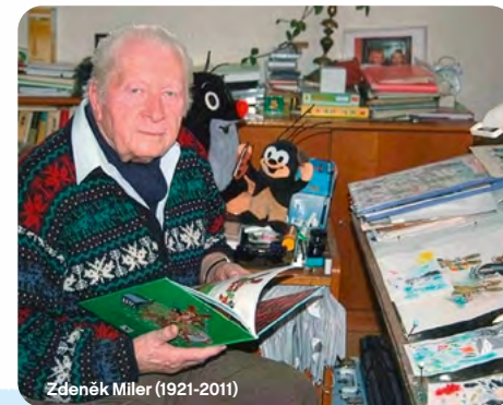
Zdeněk Miler (1921-2011)

Zdeněk Miler est un peintre et illustrateur né en Tchécoslovaquie. C'est en 1957 qu'il crée un personnage que vous connaissez tous : la Petite Taupe . C'est en se promenant dans les bois et en trébuchant sur une taupinière que Zdeněk Miler a pensé à ce personnage. Plus tard, il crée de nouveaux personnages que vous pouvez découvrir ce mois-ci : Le Criquet et Poupi !