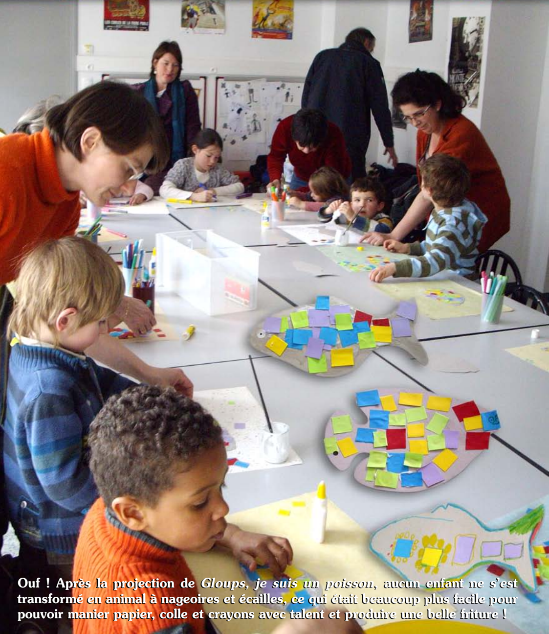
Ouf ! Après la projection de Gloups, je suis un poisson , aucun enfant ne s'est transformé en animal à nageoires et écailles, ce qui était beaucoup plus facile pour pouvoir manier papier, colle et crayons avec talent et produire une belle friture !