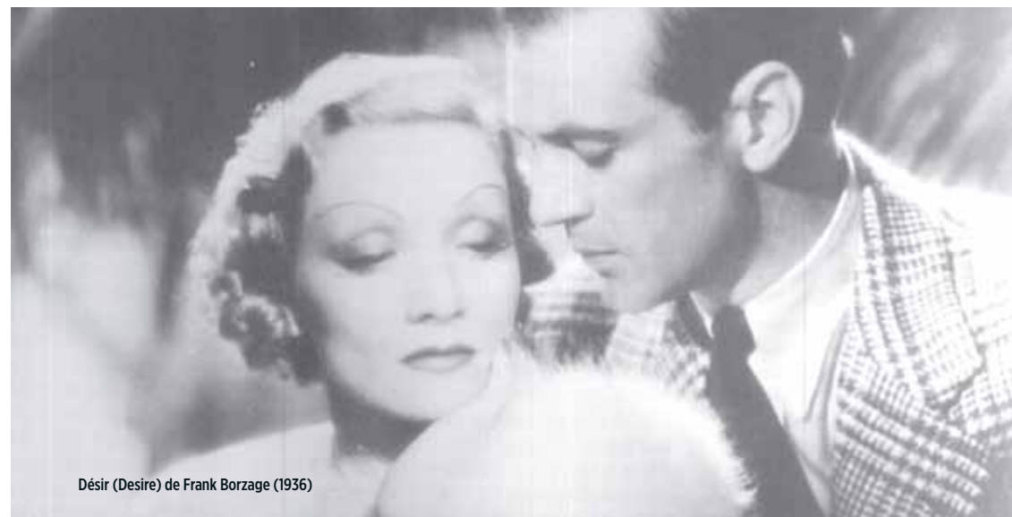
Désir ( Desire ) de Frank Borzage (1936)

Soirée présentée par Vincent Cotro, musicologue.