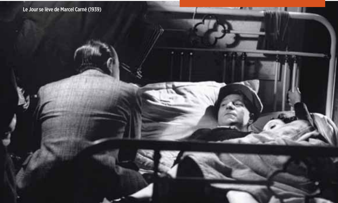
Le Jour se lève de Marcel Carné (1939)

En 1857, le Roi d'une province musulmane de l'Inde cède face à l'expansion coloniale de l'Angleterre. Mais même ce contexte politique agité ne saurait détourner Mir et Mirza, deux aristocrates indiens, de leur passion, le jeu d'échecs. Ici, Ray quitte le Bengale et pose sa caméra dans le royaume d'Avadh, région musulmane de l'Inde.