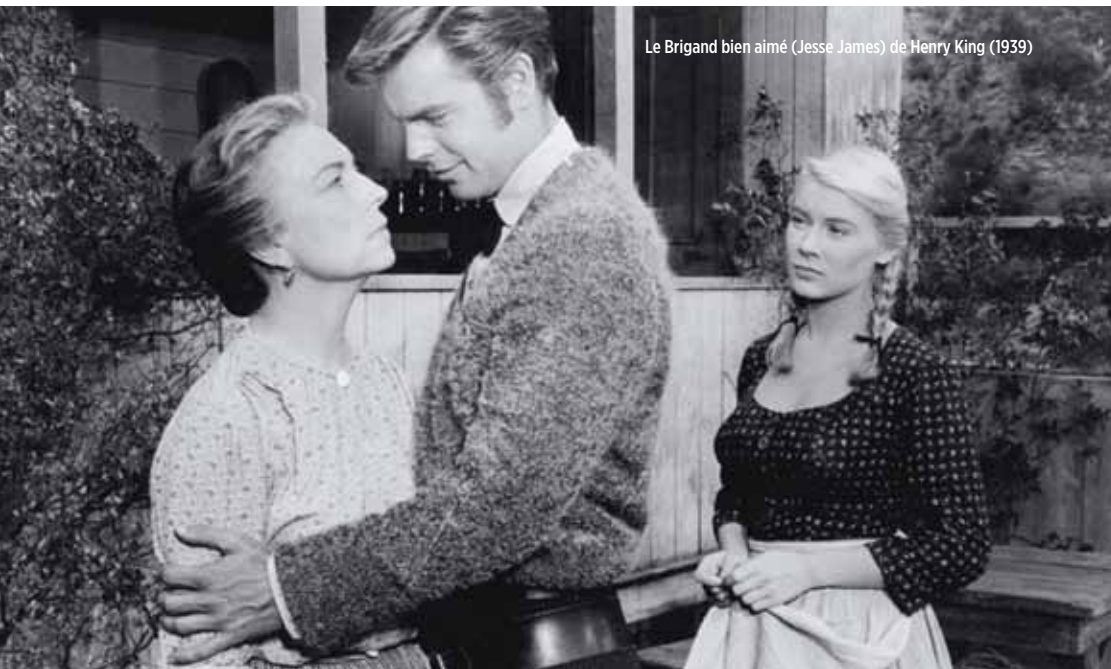
Le Brigand bien aimé ( Jesse James ) de Henry King (1939)

Pionnier du cinéma américain, Henry King revisite magistralement l'histoire et la vie du célèbre bandit Jesse James, pilleur de banques et défenseur de la cause sudiste.