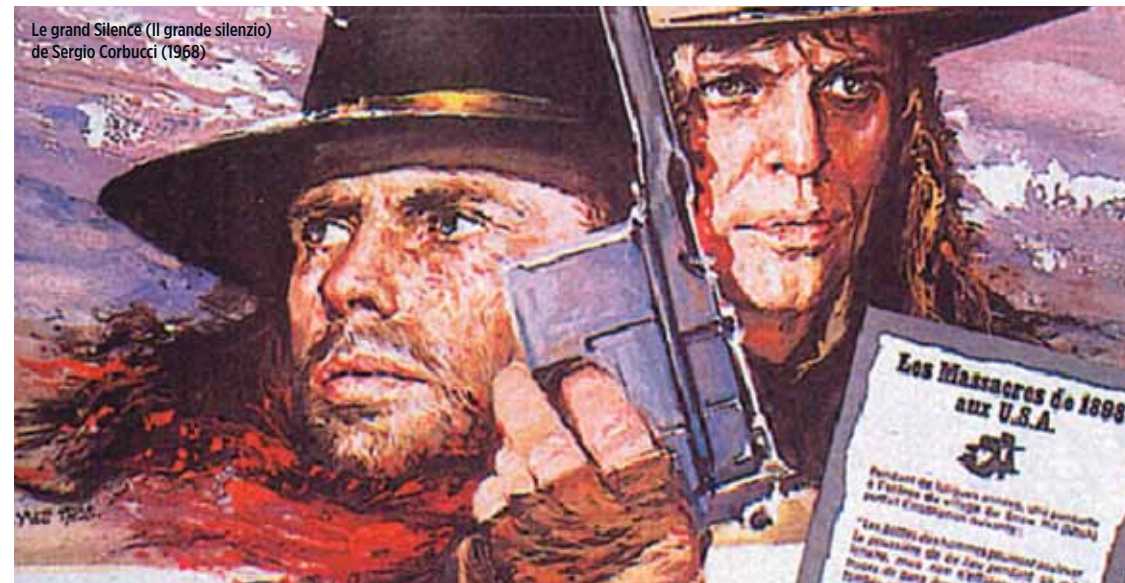
Le grand Silence (Il grande silenzio) de Sergio Corbucci (1968)