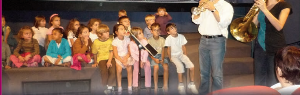
La musique de Pierre et le loup