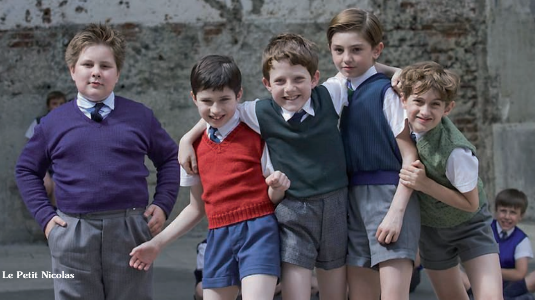
Le Petit Nicolas