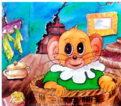
La petite souris