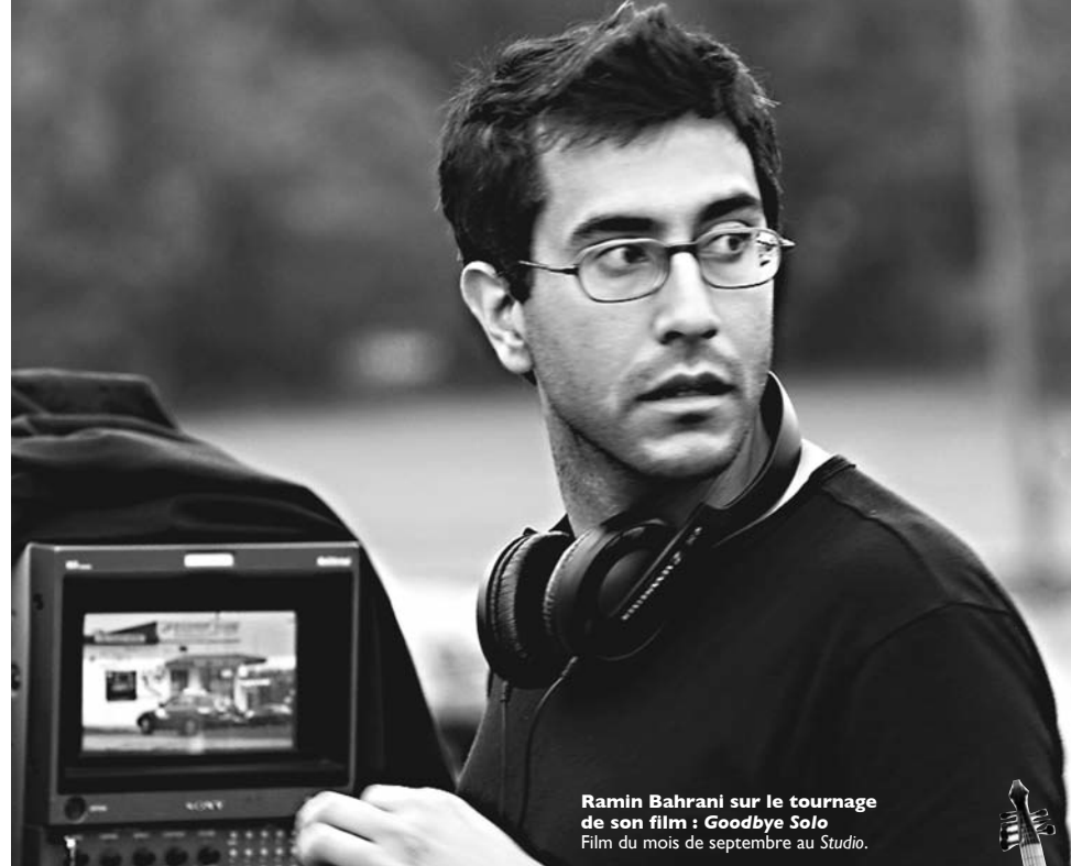
Ramin Bahrani sur le tournage de son film : Goodbye Solo Film du mois de septembre au Studio.